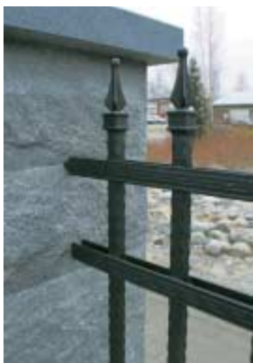
Pinnaltaan elävä Dark